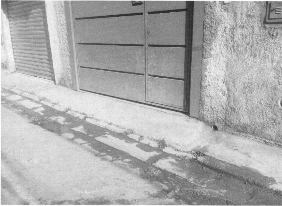
VIELA UBATUBA Nº122, VILA NATAL – MOGI DAS CRUZES.